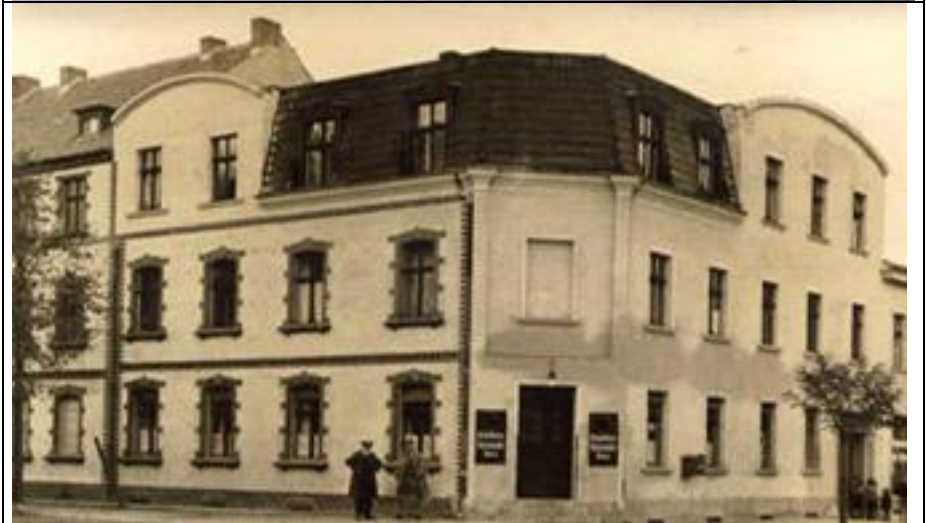
Im Wandel der Zeiten (I): oben – „vorher“ ca. 1932 (Das Haus meiner Kindheit) unten - „nachher“ 1934