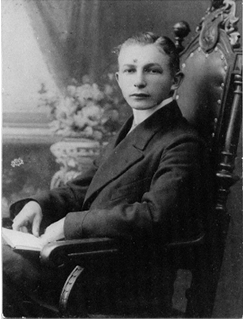
Mein Großvater, mütterlicherseits, 1909 bei der Konfirmation