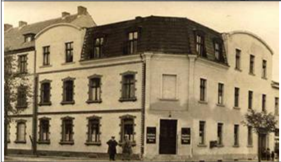
Im Wandel der Zeiten ( I ) : oben – „vorher“ ca. 1932 (Das Haus meiner Kindheit) unten - „nachher“ 1934 vgl. S.497